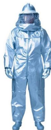
防護服着用の様子